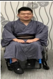
Bタイプ 影紐のある浴衣