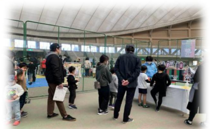
小松ゆるスポーツ 『難関突破 カブッキング』