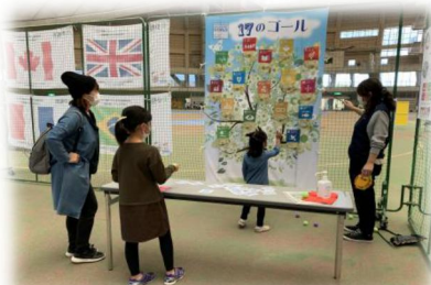
小松ゆるスポーツ 『SDGs17のゴール』