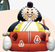
カブッキーふわふわ

カブッキーふわふわ、ボールプール、紙コップを 使って遊ぶコーナーなど、ちびっこに大人気!